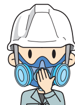
排気口をふさいで息を吐く

陽圧法 防じんマスクの面体を顔面に押しつけないように、手あるいはフィットチェッカー等を用いて排気口をふさぐ。息を吐いて、空気が面体内から流出せず、面体内に呼気が滞留することによって面体が膨張することを確認する。