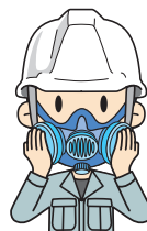
吸気口をふさいで息を吸う

陰圧法 防じんマスクの面体を顔面に押しつけないように、手あるいはフィットチェッカー等を用いて吸気口をふさぐ。ゆっくり息を吸って、防じんマスクの面体と顔面との隙間から空気が面体内に漏れ込まず、面体が顔面に吸いつけられることを確認する。